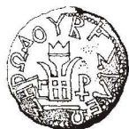
Monety z czasów Heroda